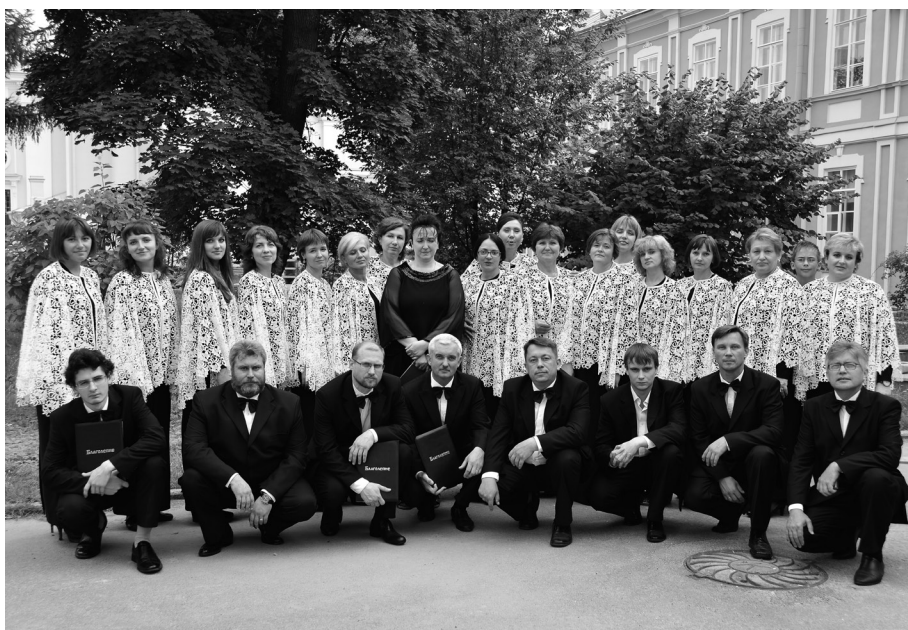
Участники вокально-хорового коллектива «Благолепие»