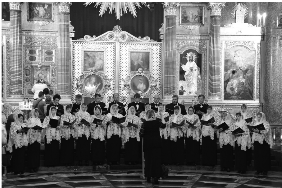
Вокально-хоровой коллектив «Благолепие» выступает в Казанском кафедральном соборе г. Санкт-Петербурга

Небесным покровителем Петербурга является святой праведный Иоанн Кронштадтский. Почти вся его деятельность была связа-