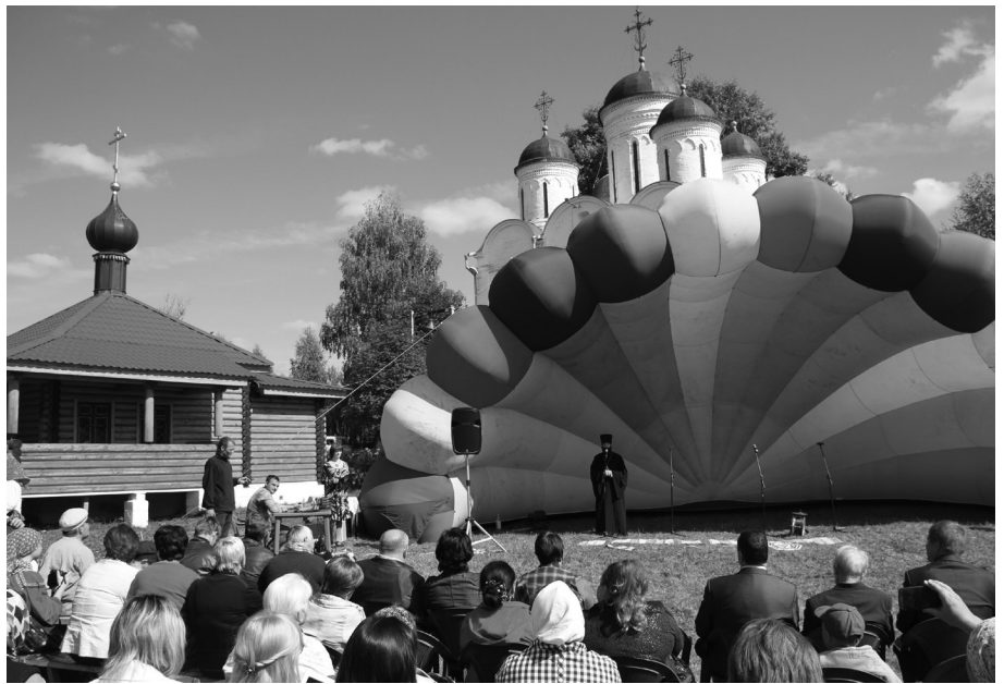
На празднование 615-летия храма Арх. Михаила собрались жители Микулино и гости праздника со всего Лотошинского района