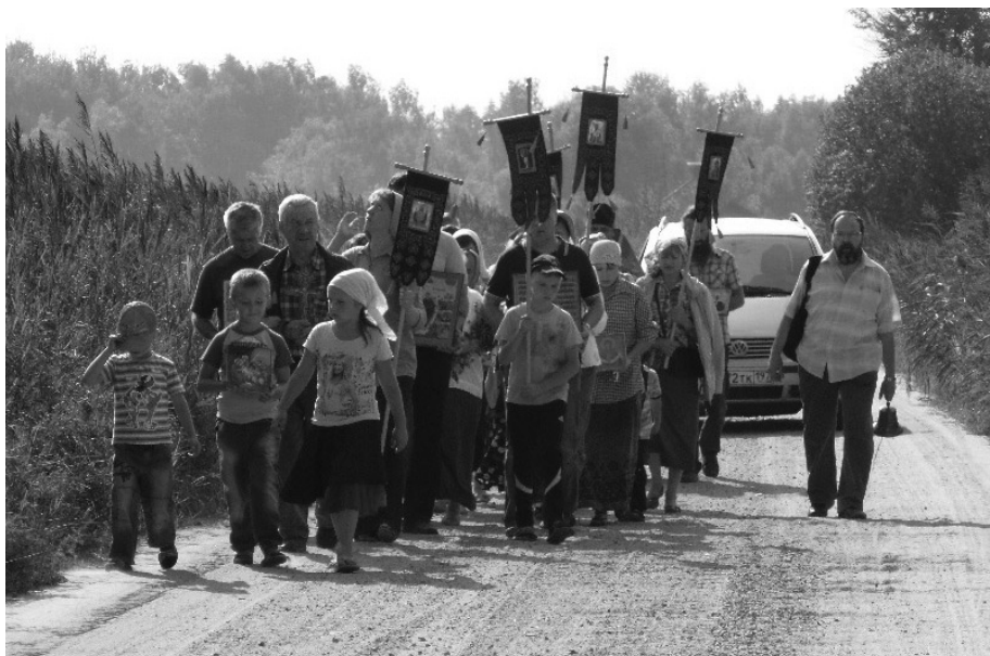
Традиционный крестный ход к Скорбященскому храму в деревне Телешово