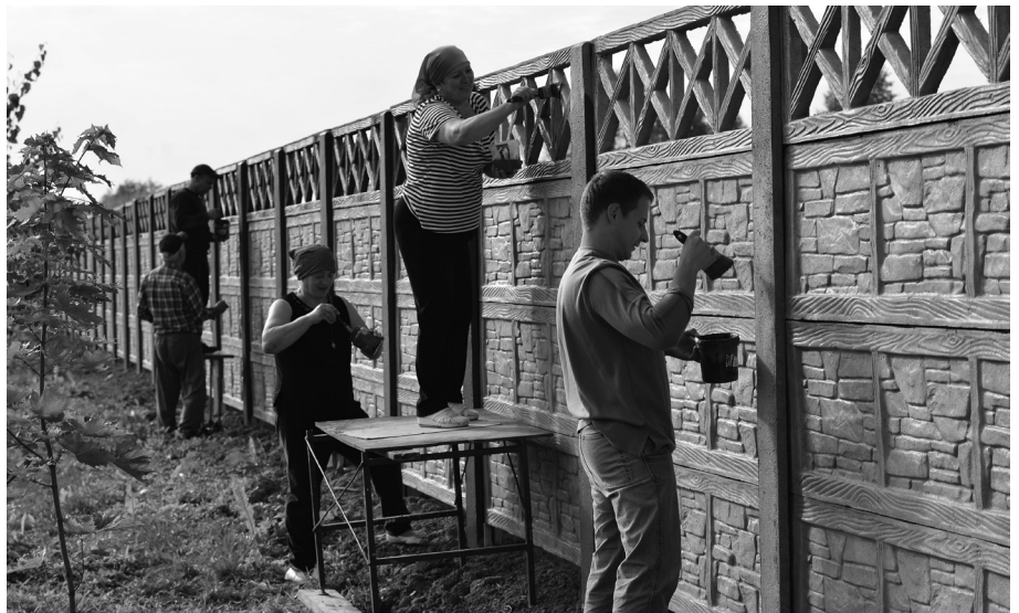
В покраске нового ограждения вокруг храма прп. Серафима Саровского участвовали сами отзывчивые прихожане храма.

был для Лотошина особым днем. К тому времени трудами представителей княжеского рода Мещерских была завершена постройка нового каменного шестипрестольного храма. С тех пор, вплоть до 20-х годов XX века, ежегодно, Лотошино наполнялось праздничным перезвоном. В огромном храме служили торжественные богослужения. Неподалеку шумела ярмарка, ведь недаром Лотошино считалось торговым селом. Потом, на многие десятилетия, замолкли колокола, не стало самого храма. Только память людская свято хранила ощущение умиротворяющей благодати от этого дня, наполненного ароматом яблок,