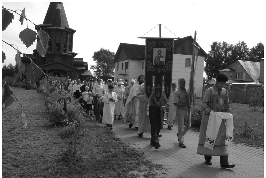
Крестный ход на Преображение Господне от храма прп. Серафима Саровского к памятному кресту на месте разрушенного в 30 гг. XX века Преображенского храма в центре поселка Лотошино