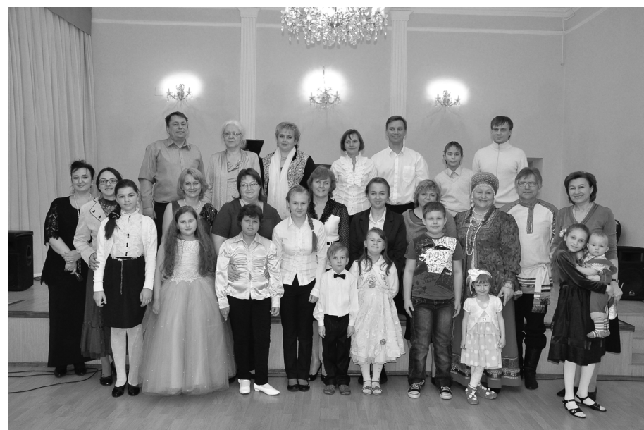
Участники вечера семейного музицирования после концерта