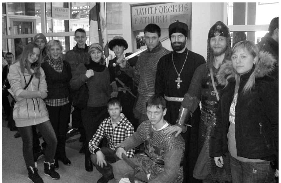
Делегация Лотошинского благочиния на VII Дне православной молодёжи, организованном Министерством физкультуры и спорта Подмоскowie