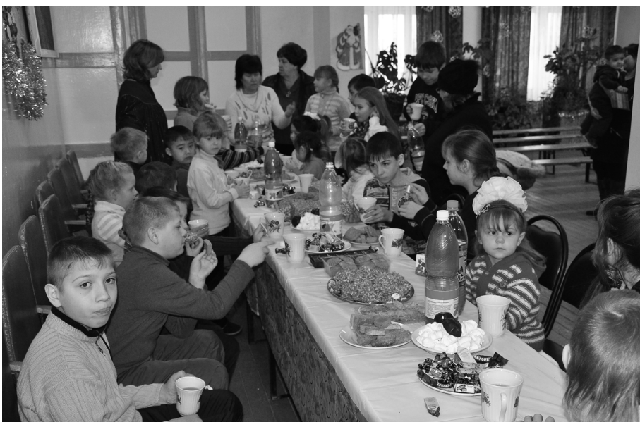
Рождественские концерты и мероприятия заканчиваются в Лотошинском благочинии традиционно – угощением для зрителей.

17 января в Детской школе искусств п. Лотошино состоялся вечер семейного музицирования, который проходил под эгидой празднования рождественских святок. Инициаторами проведения этого вечера были Лотошинское благочиние и музыкальные работники ДШИ. Эту инициативу поддержали все преподаватели и учащиеся. Целью мероприятия было желание напомнить общественности о старинных традициях и стимулировать людей, когда-то учившихся в музыкальных учреждениях, проводить домашние рождественские музыкальные вечера вместе с детьми. В программе принимали участие выпускники музыкальных школ и их родители, сами учащиеся и родственники. В концертном зале собралось около 60 человек. Выступали семейные ансамбли, музицировали юные исполнители совместно с мамами, папами, братьями и сестрами. Концертная программа получилась солидной – около 20 номеров.