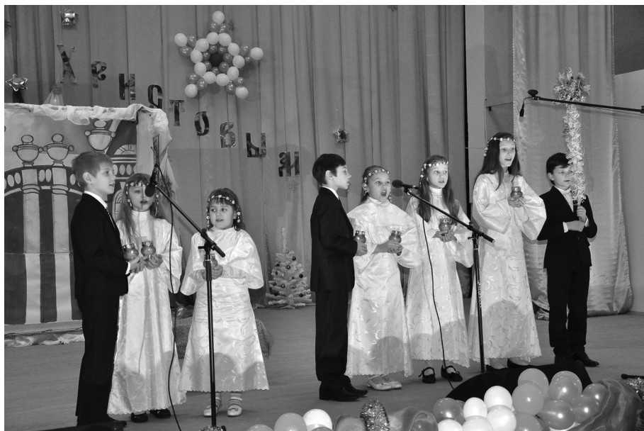
Участники рождественского представления «Кай, Герда, Снежная Королева и Рождество» на сцене КДЦ «Русь»

дакцию газеты «Сельская новь». Добрые улыбки, слова благодарности звучали в адрес христославо, которые к тому же одаривали работников районных служб шоколадками. Христославы посетили с угощениями дома тех прихожан, которые по причине болезни не могли присутствовать на праздничном богослужении.