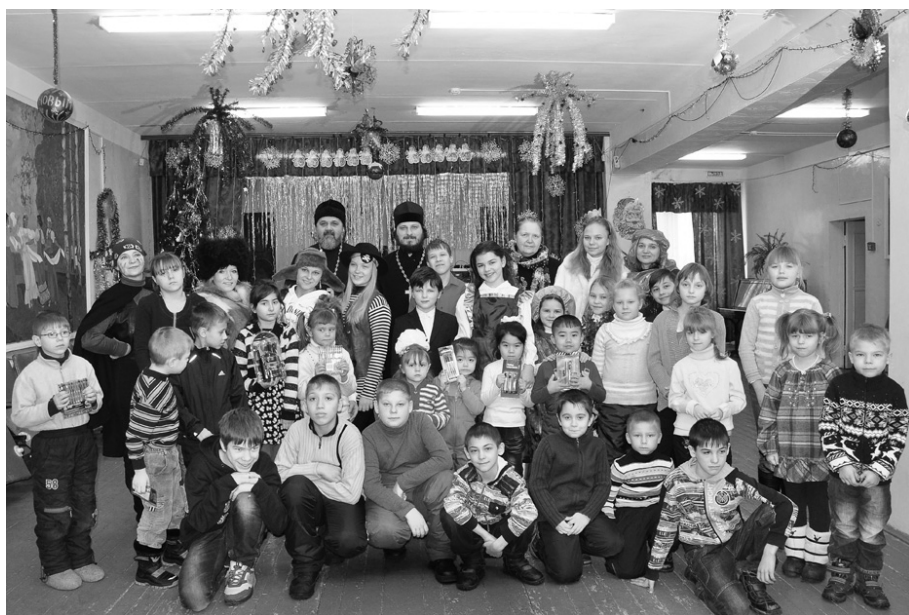
После красочного рождественского выступления в ДК п. Доры все маленькие зрители захотели сфотографироваться вместе со священниками и с артистами