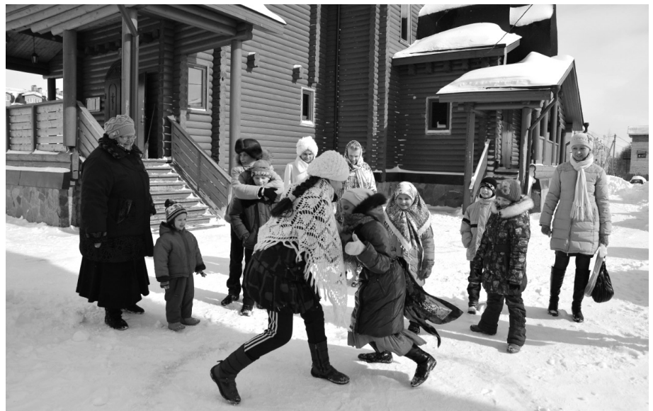
Масленичные гуляния в последний день перед Великим Постом (Прощеное воскресенье). Больше всех масленице радовались дети!

ки. Разбившись на две команды, они соревновались в зимней эстафете, азартно искали «мешок с сокровищами», играли в разные веселые игры, а в заключении просили друг у друга прощения и прямо на улице ели вкусные блины и пили горячий чай. Всем детям и взрослым понравилась эта зимняя забава перед строгим временем Великого Поста.