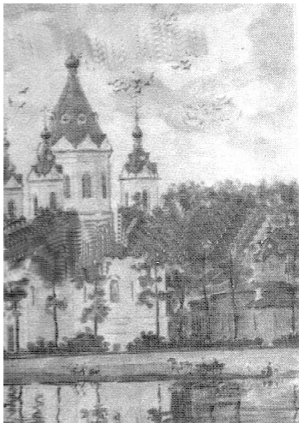
ЦЕРКОВЬ ВВЕДЕНИЯ ПРЕСВЯТОЙ БОГОРОДИЦЫ В ХРАНЕВО

верст, Старицы 40 верст; почтовый адрес: Микулино Городище, почтовая станция. Две церкви: