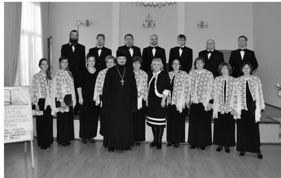
Закрытие Рождественских чтений в детской школе искусств п. Лотошино

Перед её завершением присутствующие были приглашены в библиотеку на просмотр выставки исторических материалов из архива Лотошинского благочиния «Наше духовное прошлое и настоящее», где было рассказано об истории храмов, новомучениках и меценатах благочиния. Для многих факты, пред-