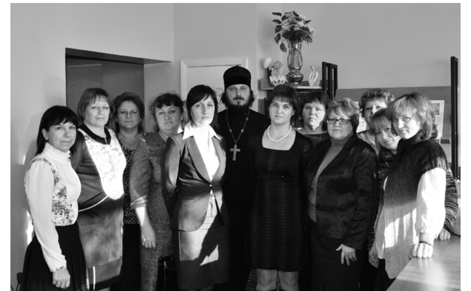
Районный семинар преподавателей духовных дисциплин