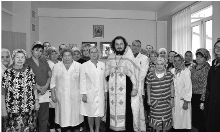
Открытие молитвенной комнаты в Центральной районной больнице