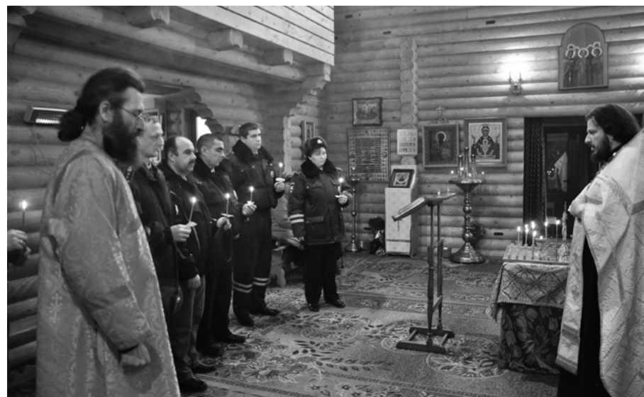
День памяти жертв ДТП в храме прп. Серафима Саровского.