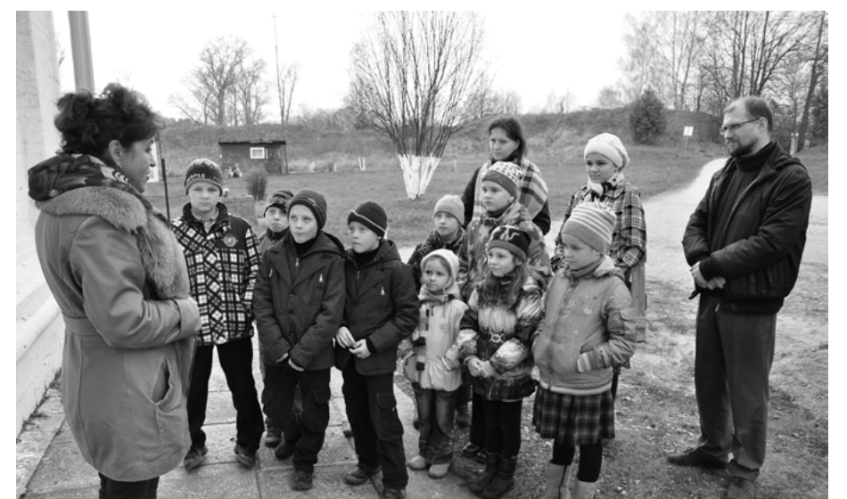
Паломничество в Микулино. Около храма св. Архангела Михаила.