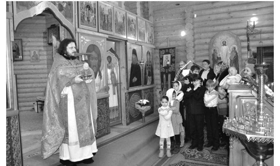
Божественная Литургия для детей в храме прп. Серафима Саровского

В ходе работы семинара участники и гости получили хорошую возможность пообщаться и поделиться опытом своей работы.